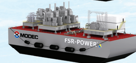
FSR-POWER® 80 a 160 MW