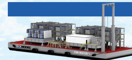
FSR-WATER® 60k m³/dia